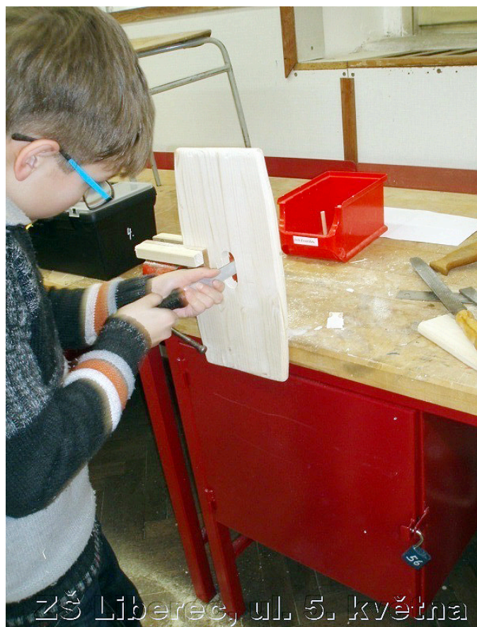
ZŠ Liberec, ul. 5. května