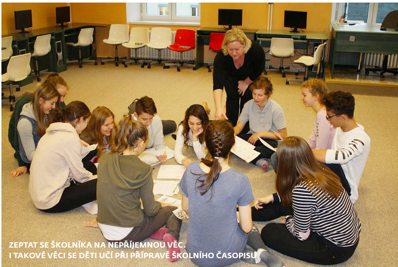
ZEPTAT SE ŠKOLNÍKA NA NEPŘÍJEMNOU VĚC. I TAKOVÉ VĚCI SE DĚTI UČÍ PŘI PŘÍPRAVĚ ŠKOLNÍHO ČASOPISU

Mediální gramotnost lze učit různě. Z třicítky dětí z liberecké ZŠ Lesní se stali reportéři, editoři i fotografové. Tvoří totiž takzvaný Lesní časopis, a to přímo během vyučování. Osmáci a devátáci se tak zábavnou formou vzdělávají v mediální oblasti, učí se kritickému myšlení, vyjadřování, komunikaci a prohlubují své dovednosti při zacházení s diktafonem, skenerem a další technikou.