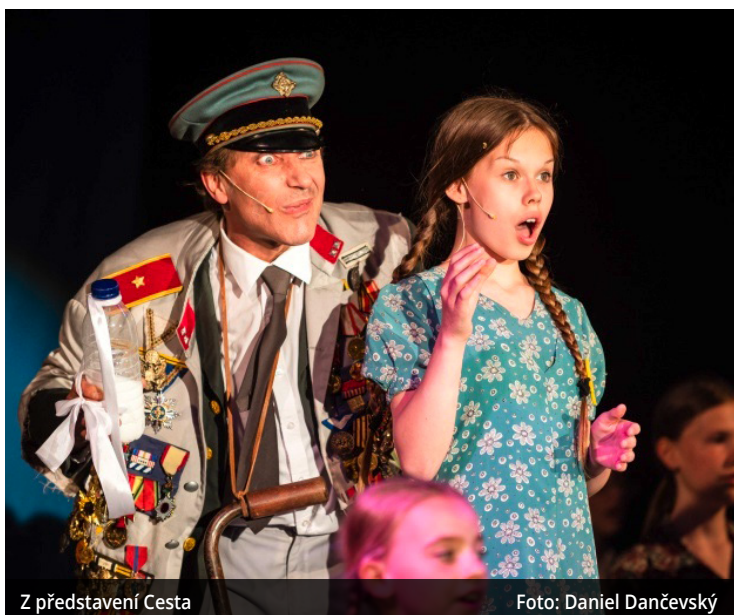
Z představení Cesta

V divadle představení uvádějí zvonění, na nádvoří LVT (symbolické železniční nástupiště, jehož provoz stravuje precizní esesácký grafikon) sedmero odbíjení zvonu na nedaleké muzejní věži. Už při tom se musel každý divák zachvět.