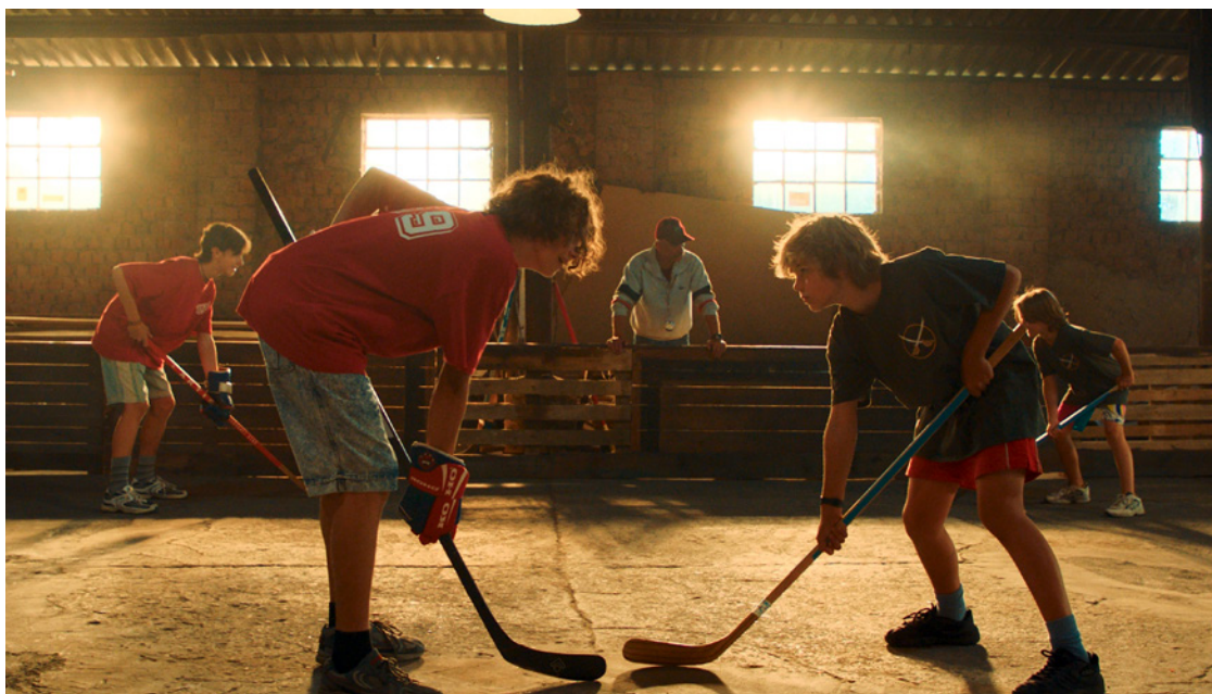
Děti Nagana je sportovní, komediálně laděný snímek režiséra Dana Pánka, určený pro celou rodinu.

Říjnový mezinárodní festival sportovních filmů Sportfilm Festival Liberec nabídne svým návštěvníkům mimo jiné i celorepublikovou filmovou premiéru, mistrovské sportovní dokumenty, unikátní výstavy, besedy a sportovní eventy.