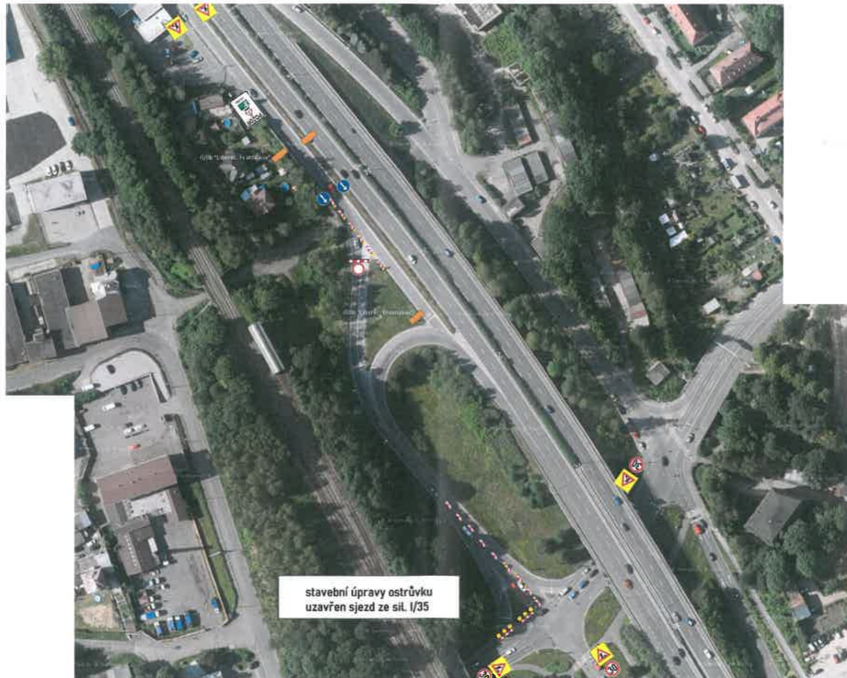
stavební úpravy ostrůvku uzavřen sjezd ze sil. I/35