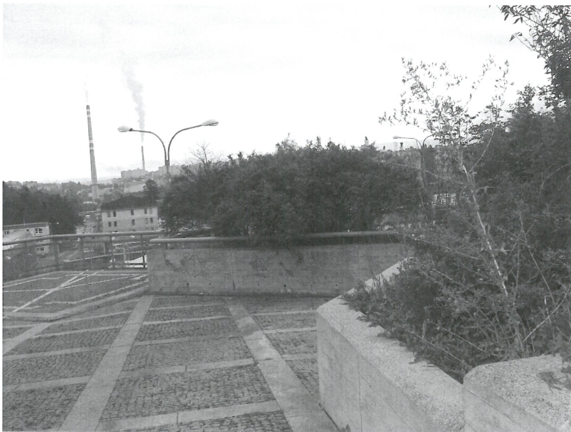
Část pozemku p.č. 2080/1 nad tělesem R35, mimo areál žadatele